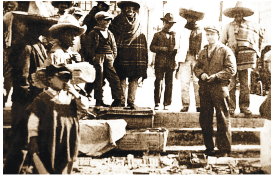
En el Mercado del Volador

Otros exhibían sus artículos en el piso de lugares cercanos a los mercados públicos.