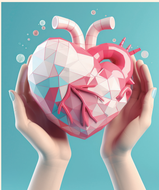
*Aish Latino *El autor es Rabino, periodista, cineasta y cofundador de Honest Reporting.

En la realidad cada caso es diferente. Un gran número de consideraciones halájicas deben ser revisadas y tomadas en cuenta. Por ende, antes de seguir cualquier procedimiento, consulta con alguna autoridad Rabínica experta en la materia, pues de acuerdo con el judaísmo el procedimiento correcto no es tan sencillo como sellar una tarjeta de donación de órganos.