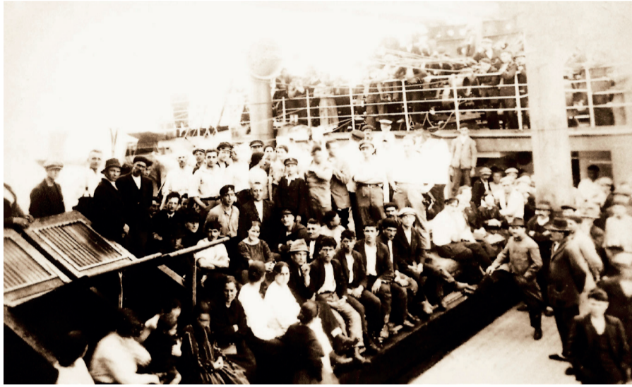
Llegada a Veracruz